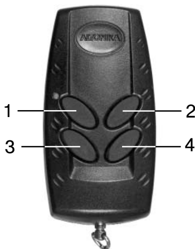
Рисунок №1. Брелок.

Управление охранно-противоугонной системой Reef Net R-501D (далее система) производится с помощью четырехкнопочного брелока. Брелок снабжен световой и звуковой сигнализацией. Расположение кнопок брелока указано на рисунке №1.