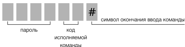
Рис. №2. Порядок ввода команды после соединения.

Нажатие на кнопку * до нажатия кнопки # отменяет ввод всех набранных команд.