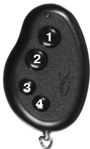
Рис. 1. Нумерация кнопок брелока.

Управление работой системы осуществляется по командам четырехкнопочного радиобрелока. Дальность действия брелока порядка 30 м. При уменьшении дальности действия проверьте напряжение батареи в брелоке и при необходимости замените ее (см. раздел "Замена батареи в брелоке"). Распознавание транспондера происходит после того, как брелок подносится вплотную к месту установки антенны.