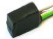
Рис.1. реле PW RB 1р.

Блокировки осуществляются встроенным силовым реле с контактами НР/НЗ типа (тип блокировки программируется) и внешними электромагнитными реле PW RB1р.